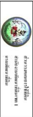
รูปที่ 3-3 แผนที่สภาพการใช้ที่ดิน ตำบลบ้านยาว อำเภอเมืองนครพนม จังหวัดนครพนม